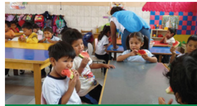
DONACIÓN DE SANDÍA A COLEGIO PARROQUIAL

Fundo María Luisa realiza donaciones de Sandía Quetzali al Colegio Parroquial Corazón de Jesús de Jicamarca, ubicado en Huaral