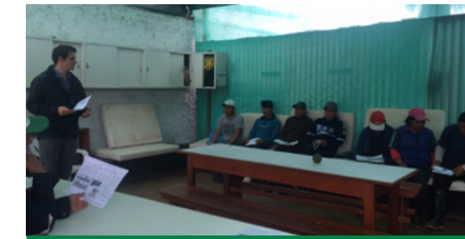
CHARLAS DE PREVENCIÓN FENÓMENO DEL NIÑO

Fundo María Luisa realiza donaciones de Sandía Quetzali al Colegio Parroquial Corazón de Jesús de Jicamarca, ubicado en Huaral